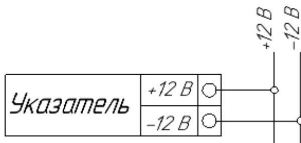
Рисунок 3 - Схема подключения указателя к сети