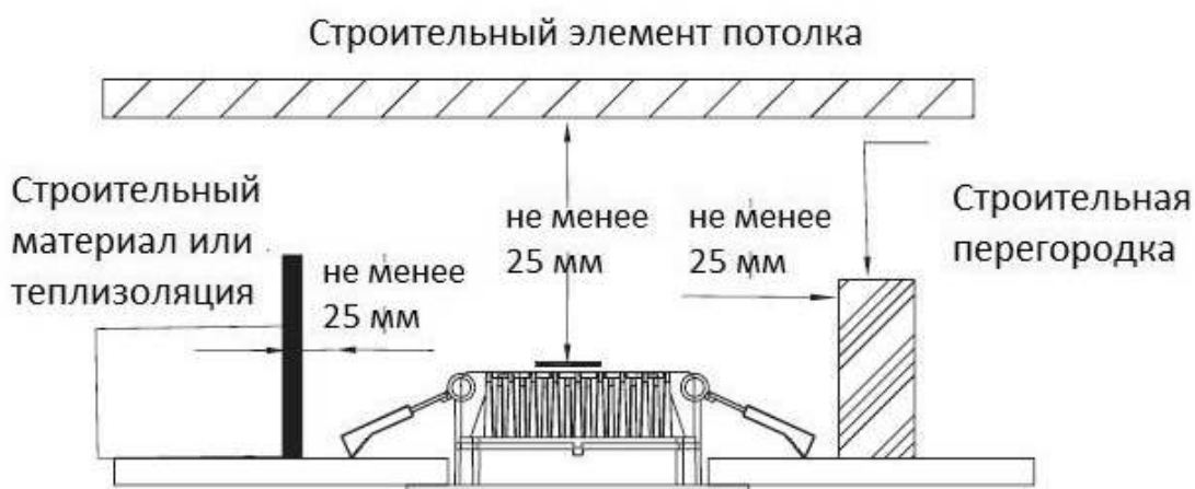
Рисунок 2 - Схема установки светильника в потолок