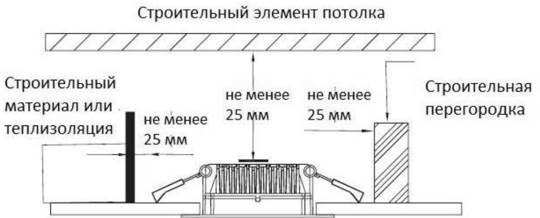
Рисунок 2 - Схема установки светильника в потолок